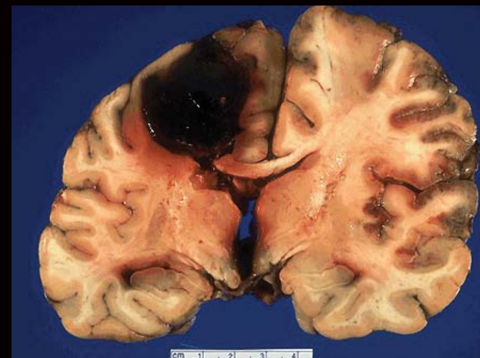
สมองจริงที่ถูกทำลายโดยสารเสพติด